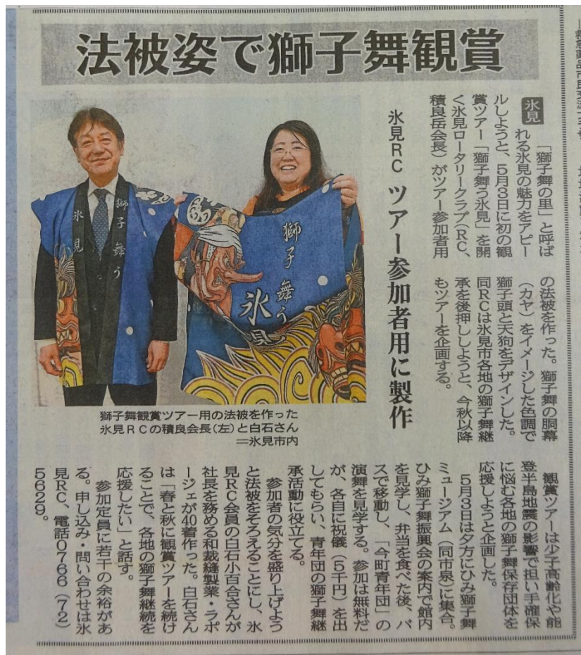
2026年4月22日 北日本新聞掲載