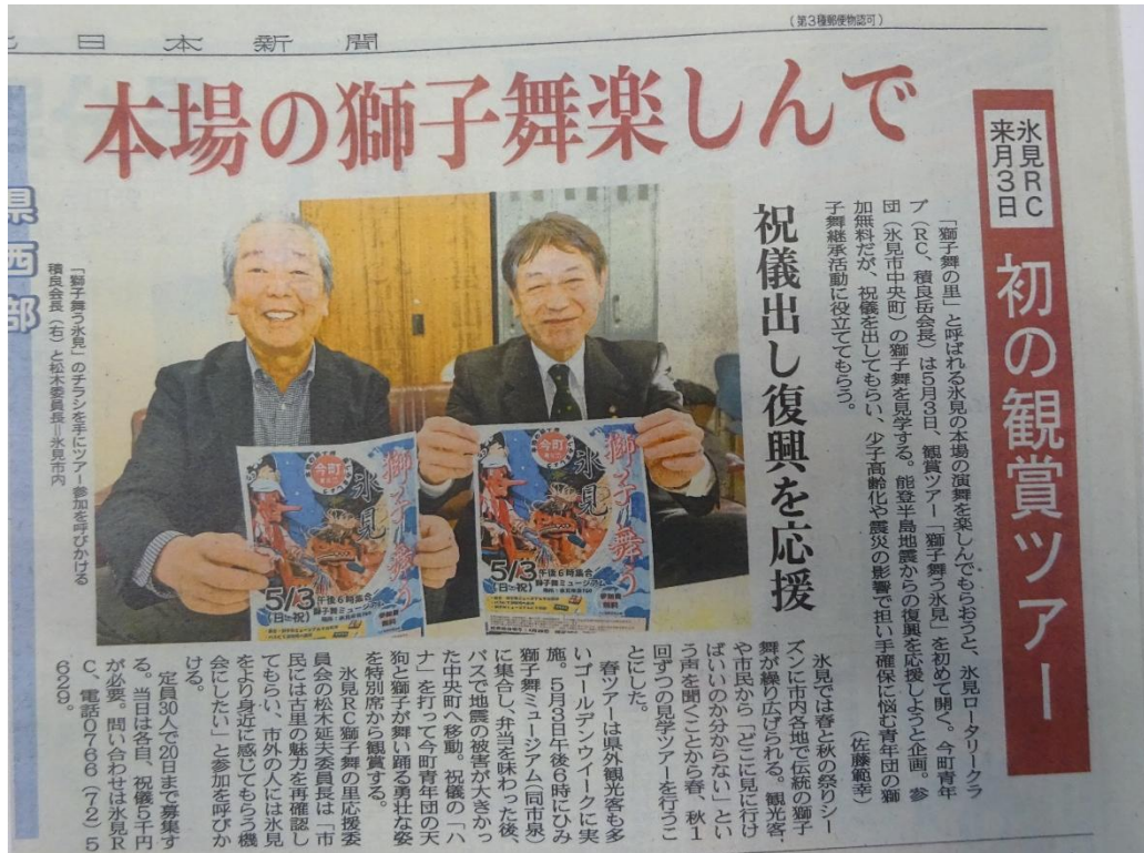
2026年4月8日 北日本新聞掲載